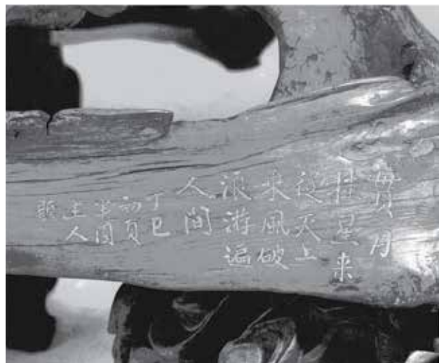
图2 流云槎题刻 （流云木槎[J]. 紫禁城，2015（6）：10-11.）