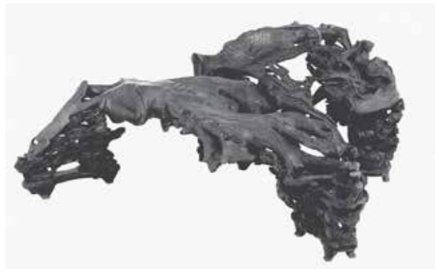
图1 流云槎现状 （流云木槎[J]. 紫禁城，2015（6）：10-11.）

园中原藏珍贵家具极多，其中以源自扬州康山草堂的流云槎最为著名，现藏于北京故宫博物院，文物编号为“新 99227”，级别为“一级乙”。此物实际上是一件用天然柚木根修正而成的坐具，形似船只，取名为“槎”，兼有“枝杈”和“木筏”双重含义。树根下配楠木透雕流云基座，造型古雅（图1）。槎上有明代画家赵宦光所书篆额“流云”二字，另有5处题跋：其一为明代书画大家董其昌所作之五绝诗：“散木无文章，直木有先伐。连蜷而离奇，仙槎与禅筏。”另外4处分别署名陈继儒（明代书画家）、阮元（清代名臣、学者）、“半园主人”和衡永（麟庆后人）。其中半园主人所题为一首四言诗：“贯月挂星，来从天上。乘风破浪，游遍人间。”落款“丁巳初夏半园主人题” ④ （图2）。