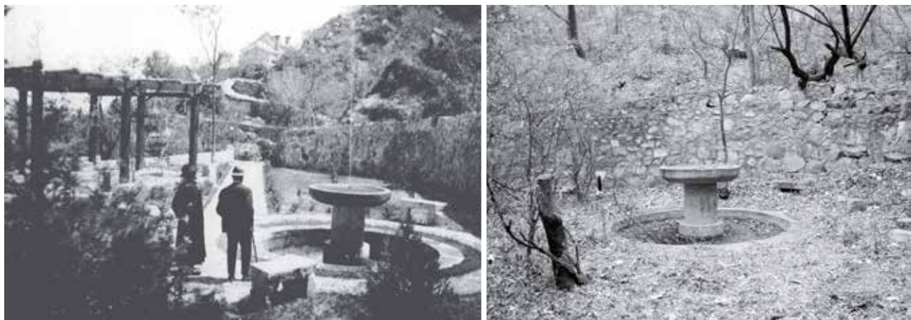
图 14 贝家花园喷泉旧照与近照

(左图: 大盛, 迟红蕾。法国医生贝熙叶与他的中国病人 [M]. 冯克力. 老照片: 第 99 辑. 济南: 山东画报出版社, 2015, 右图: 作者自摄)