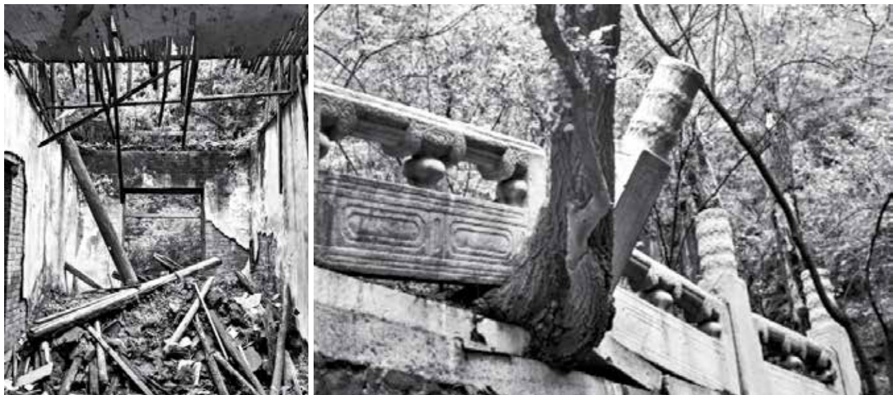
图 15 菲云馆室内与清风阁围栏现状

(李天飞. 寻访女词人顾太清深山故居 [N]. 北京晚报, 2015-11-30 (34).)