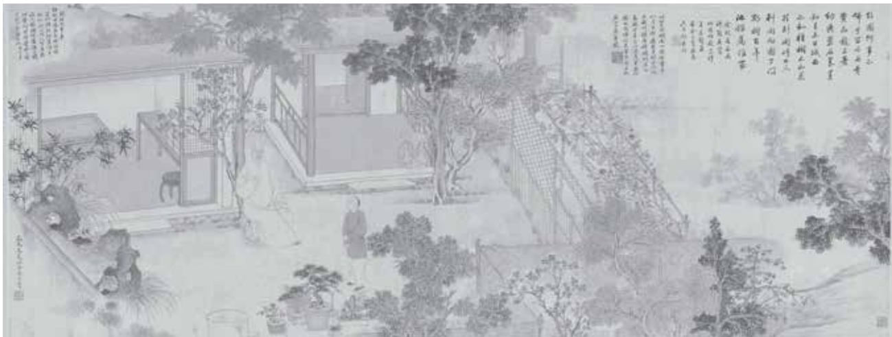
图10 清代吴偶绘《息园图》 (南京博物院藏)

别墅，狄庶常为此会，余诗未就，属有责言，以九月晦补之。”诗云：“一年能得几回春，一春几处花争发。有花有酒作春游，如此无诗宁辞罚。今年三月春向阑，慈仁海棠开乍歇。李家园子落城西，倒影门前增寿刹。梁公裔孙富文翰，晨起相邀罢朝谒。虽无金谷盛箫管，聊学兰亭具笔札。……” [24]