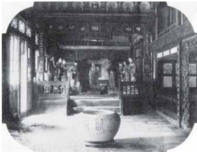
图7 颐寿堂室内戏台

(喜龙仁. 中国园林 [M]. 赵省伟, 邱丽媛, 译. 北京: 台海出版社, 2017.)