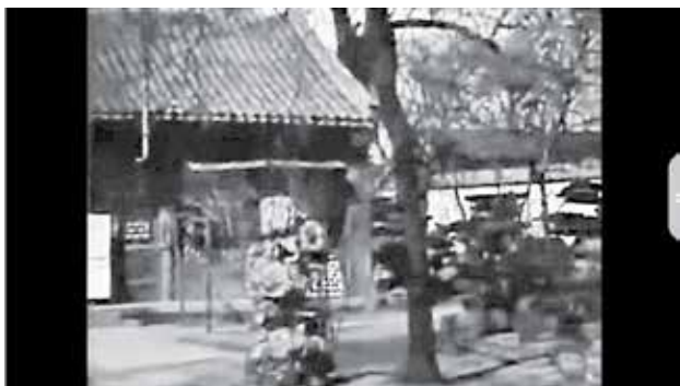
图3 半亩园早期视频截图

“失重的梁柱”曾在新浪微博披露了一段中华民国时期所摄北京半亩园的黑白影像资料（图3），极为珍贵，题为“一座北平著名的旧园”（A Noted Old Garden in Peking），长度为1分43秒，推测拍摄时间大约为1945年，当时半亩园已经被麟庆后人售与黄氏。影像先后展示了半亩园北部嫔嫒妙境与南部玲珑池馆一带的景物，建筑、假山、花木均保存完好，且在嫔嫒妙境院南可见一堵新筑的白粉墙，墙上绘出漏窗的轮廓，但尚未开洞。