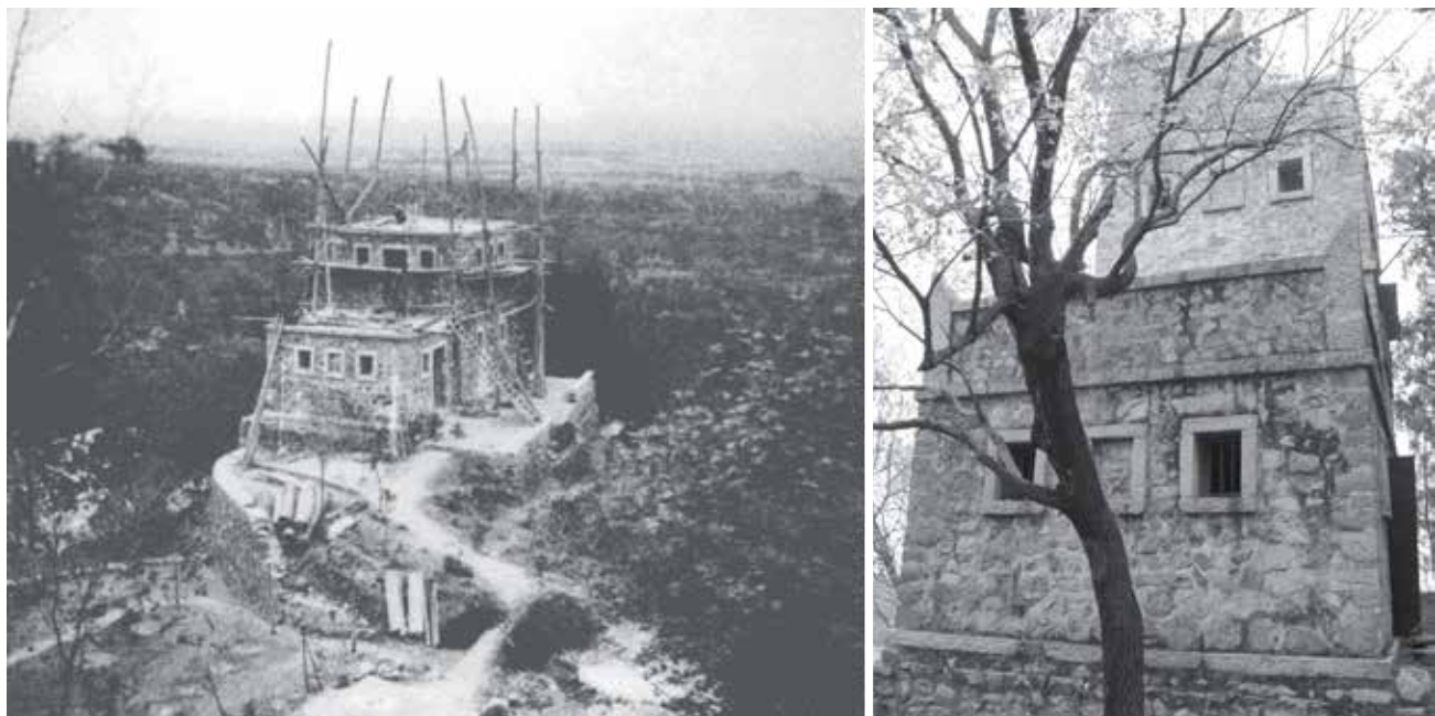
图 13 贝家花园碉楼旧照与近照

(左图: 大盛, 迟红蕾。法国医生贝熙叶与他的中国病人 [M]. 冯克力. 老照片: 第 99 辑. 济南: 山东画报出版社, 2015, 右图: 作者自摄)