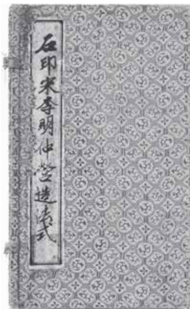
图1 石印丁本《营造法式》