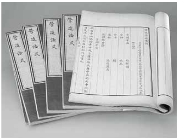
图6 故宫影宋本《营造法式》 (故宫博物院)(左)