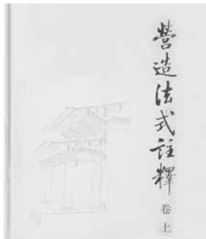
图7 中国建筑工业出版社 出版梁思成《营造法式注释》 卷上(右)

诚撰将作《营造法式》三十四卷，其壕寨，石作，大、小木，雕、旋、锯作，泥瓦，彩画刷饰，俱各分类为书。” ①