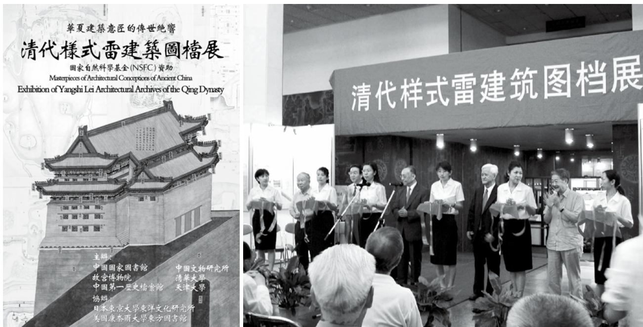
图3 “华夏建筑意匠的传世绝响——清代样式雷建筑图档展”海报及开幕式照片(2004年8月12日拍摄)

经过学术界的不断探索,并在国家图书馆的不懈推动与努力下,2007年6月20日“中国清代样式雷建筑图档”被联合国教科文组织列入《世界记忆名录》,成为其中规模最大、内容最丰富的古代建筑设计图像资源,至此明确宣示,长久以来世界建筑史上有关中国古代建筑设计理念和方法等的“失语症”势将终结(图4)。