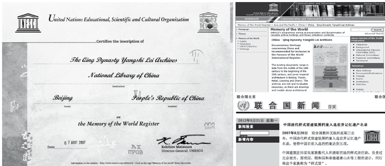
图4 联合国教科文组织《世界记忆名录》证书及官方网页截图（2007年）